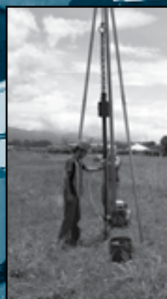
Ensayos destructivos realizados por el Área Hormigones - UIDIC