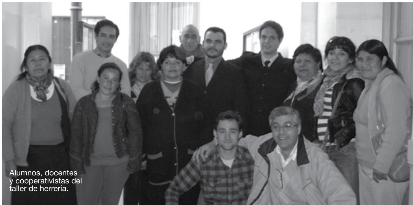
Alumnos, docentes y cooperativistas del taller de herrería.