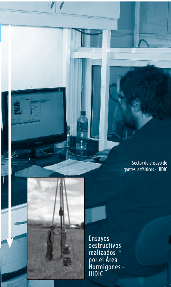
Sector de ensayo de ligantes asfálticos - UIDIC

Dentro de las políticas que tiene la Unidad, como camino a seguir, es acreditar la UIDIC bajo normas ISO – International Standard Organization que son pautas de calidad para acreditación o certificación-. A diferencia de otras disciplinas de la ingeniería, el área de Construcciones es, históricamente, un área bastante retrasada con respecto a normativas de calidad, si bien dentro de lo que era el LaPIV hay un largo camino recorrido con respecto a la calidad. Nosotros creemos que tenemos que estar un escalón más arriba de ese margen. Una de las ideas es que todas las áreas se sumen a este sistema de calidad. Es un proceso ambicioso y complejo. ■