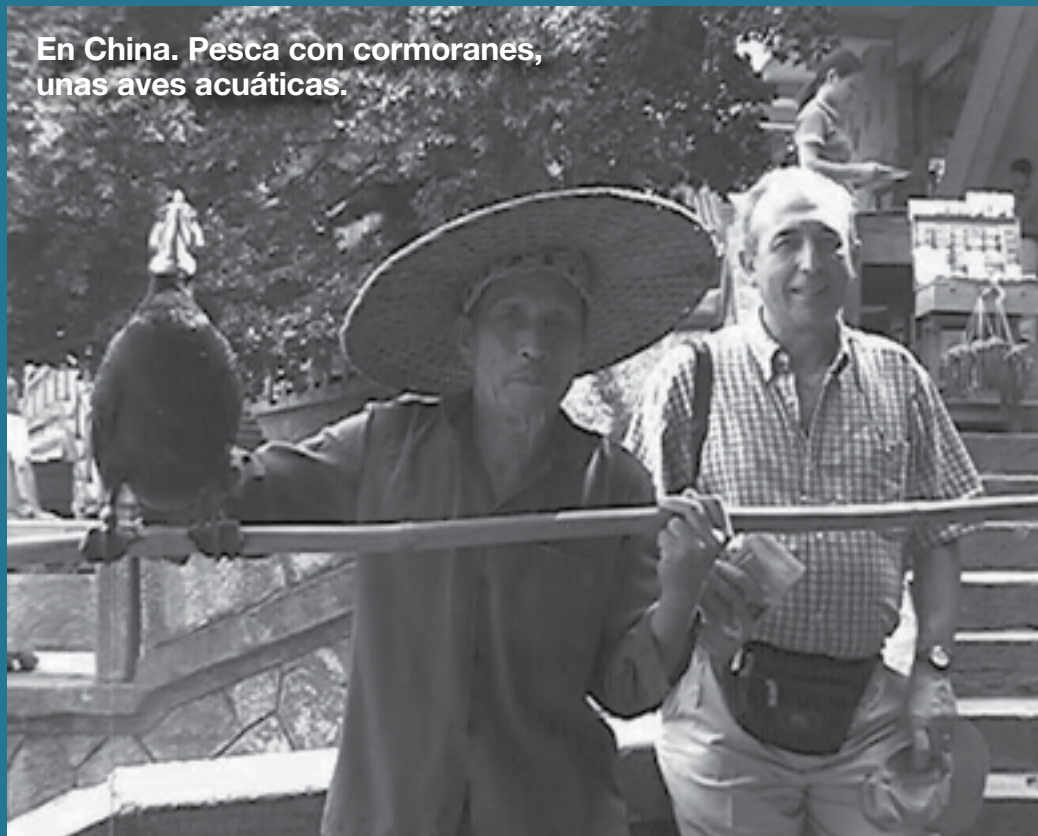
En China. Pesca con cormoranes, unas aves acuáticas.